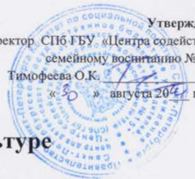
График работы инструктора по физической культуре